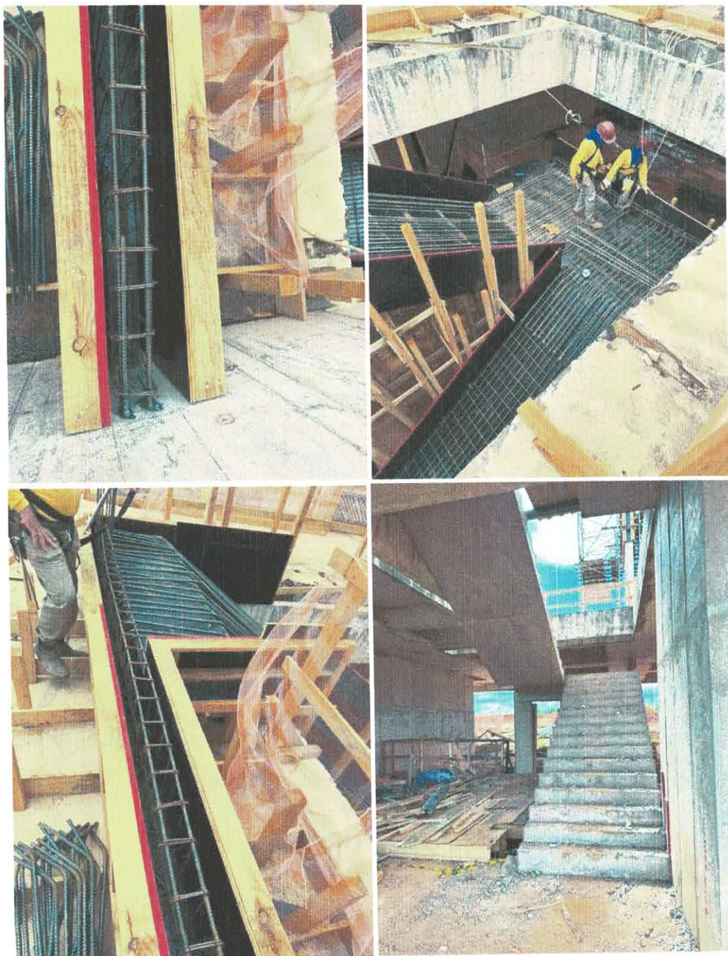
Foto 10 – Escada de concreto armado do Terreo para o 1ª pavimento.